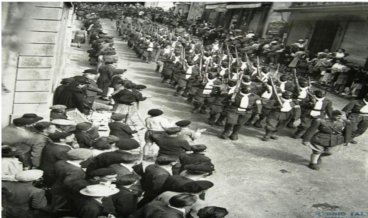
défilé à Romans, le 8 septembre 1944.