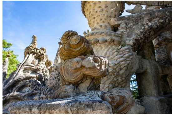
La pierre initiale qui fit trébucher le Facteur