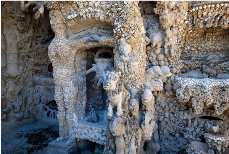
Le facteur avait imaginé des fontaines, mais elle abimait trop la structure