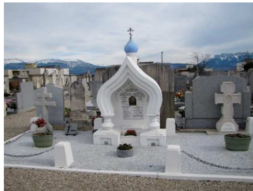
Visite du cimetière