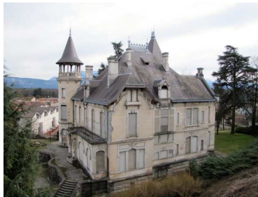
Château de l'Orgère dit château des russes